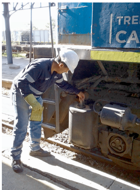
Revisión del arenero.