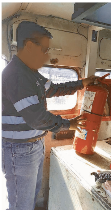
Revisión de matafuegos en cabina.