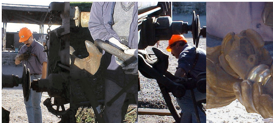
Secuencia de acople de vagones

Al finalizar las tareas, salir de la zona entre vagones del mismo modo y tomando las mismas precauciones que al ingreso a la misma. Luego comunicar al conductor dándole el aviso de "operación terminada".