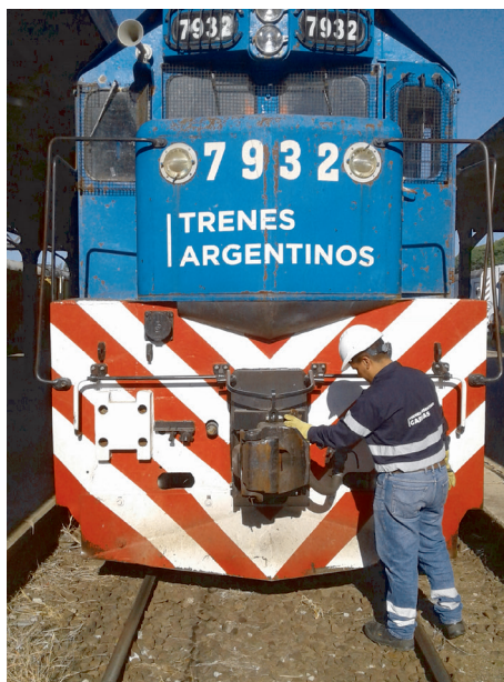
Revisión visual del estado de la parte del vehículo.