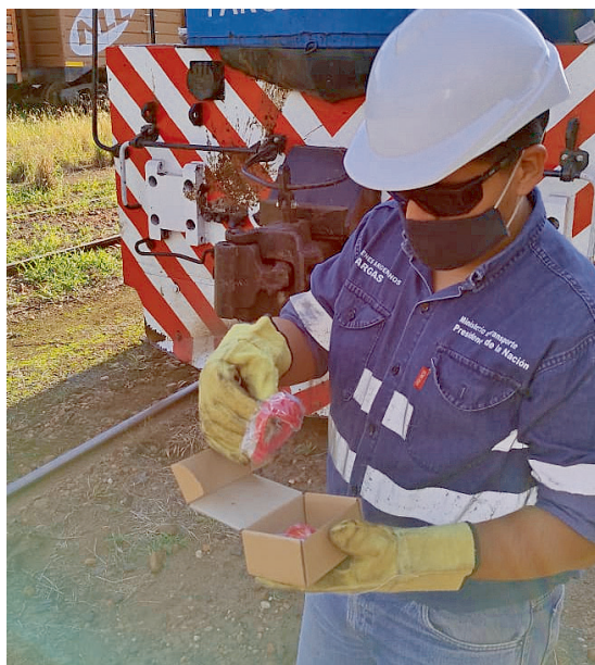
Manipular los petardos con cuidado

Petardos: Se utilizan cuando es necesario lograr una señalización acústica, por fuerte detonación sobre los rieles ante una obstrucción de la vía. Los petardos deben colocarse en cantidad no menor de 3 sobre un riel de la vía afectada y a veinte metros uno de otro. Deben apretarse bien sus abrazaderas a la cabeza del riel y a partir de los ochocientos metros del punto a proteger.