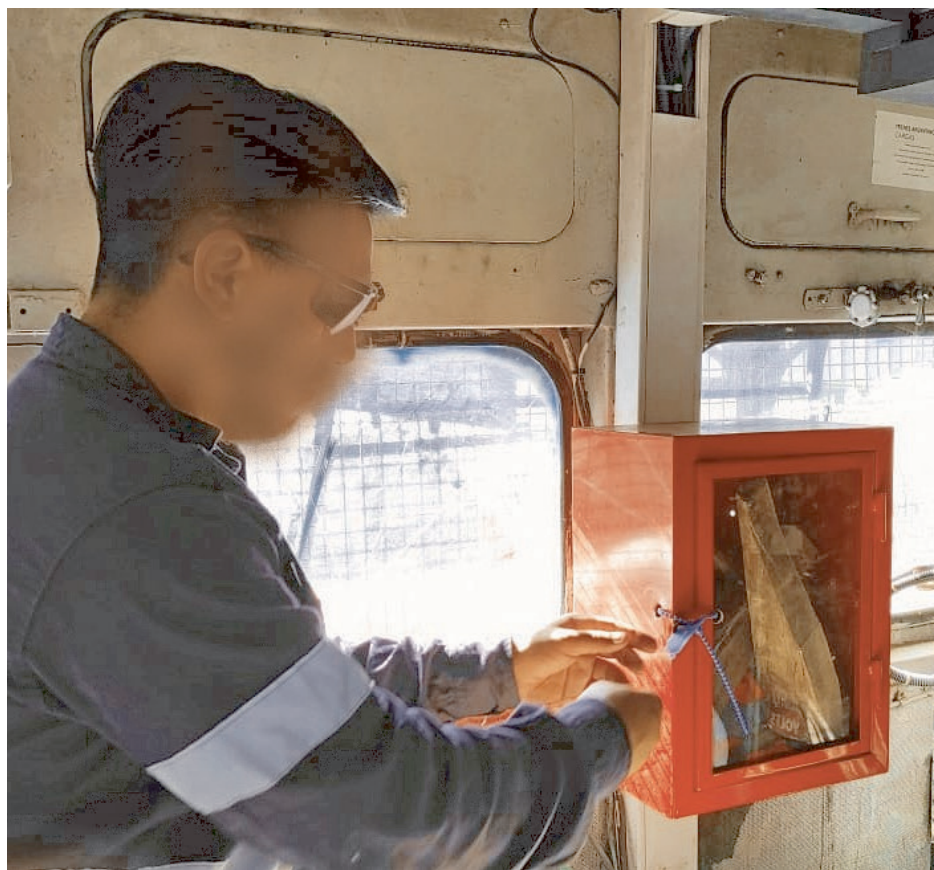
Verificación de precintos de elementos de seguridad.