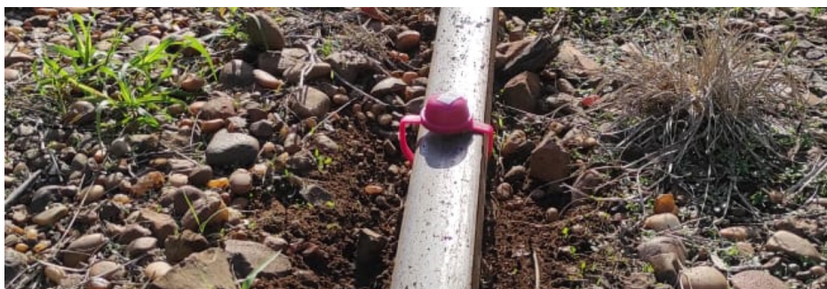
Colocación del petardo en vía