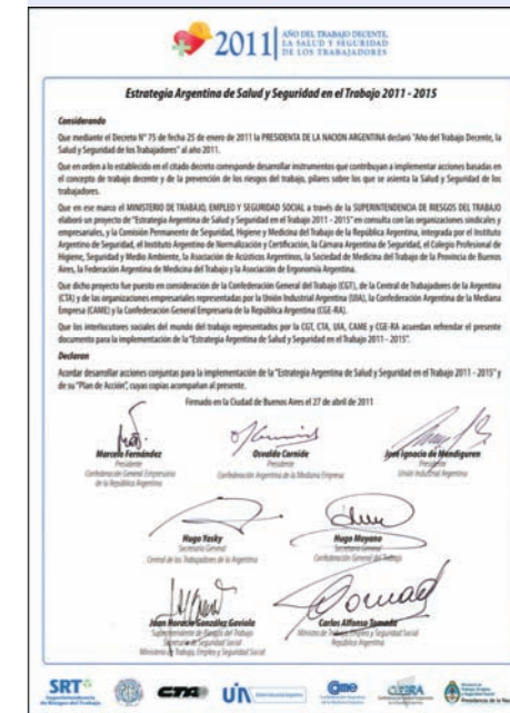
Facsímil del Acuerdo Tripartito para la implementación de la Estrategia Argentina de Salud y Seguridad en el Trabajo 2011-2015.

Como resultado de este trabajo conjunto que se continúa realizando, aspiramos a concretar las metas estratégicas para el período 2011-2015: